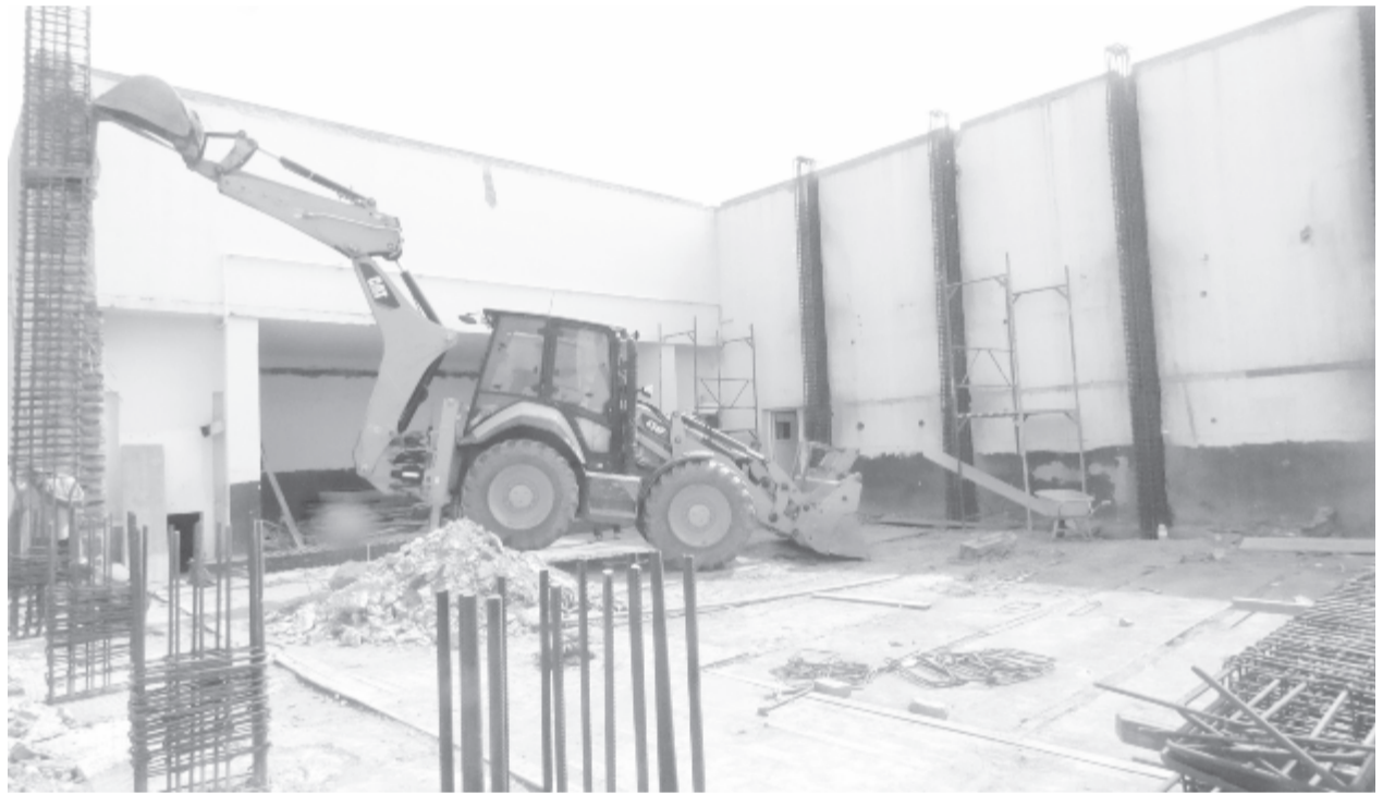
Az épület új vasbeton tartószerkezete készül

Egy korábbi pályázat során LEADER-alapok felhasználásával az önkormányzat 80 székét vásárolt a nézőterre, a színpadra mozgatható függőnyt, szerkezettel együtt, ezeket jelenleg rak-táron tartják, később visszakerülnek az épületbe.