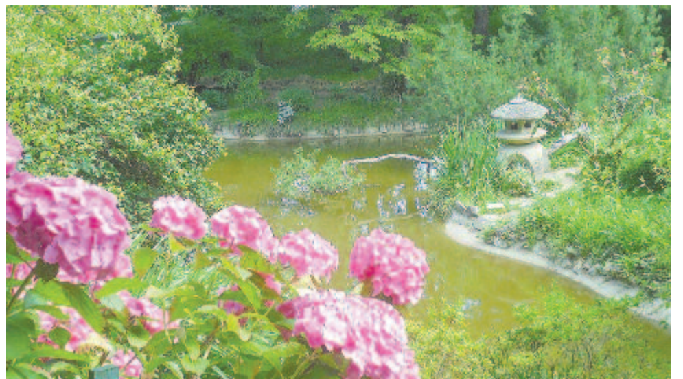
Hangos virág kiált, bíbor színekkel esdve, hogy jöjjön már a bíbor estve – japánkerti hortenziák

Azonban a csűrök koros gyermekekkel, Körülveszik magok sok soros rendekkel. Hevernek mellett izmos asztagjai, Eldültek körülök megnyúlt kazaljai. Pufog a tót széjjel csikorgó csépjével, Izzad és küszködik a búza fejével. Így a nyár megadván világának javát, őszi, s halálához készítgeti magát. Zöldellik ugyan még néhol az erdőkrül, S vidámnak is tetszik a kies berkekrül; De öregségéhez mégis közel érvén, Bágyad, a világnak adóját fizetvén. Mint egy asszony, ki ha sok gyermekeket szül, Megfárad, s vérbe végtére lassan hül.