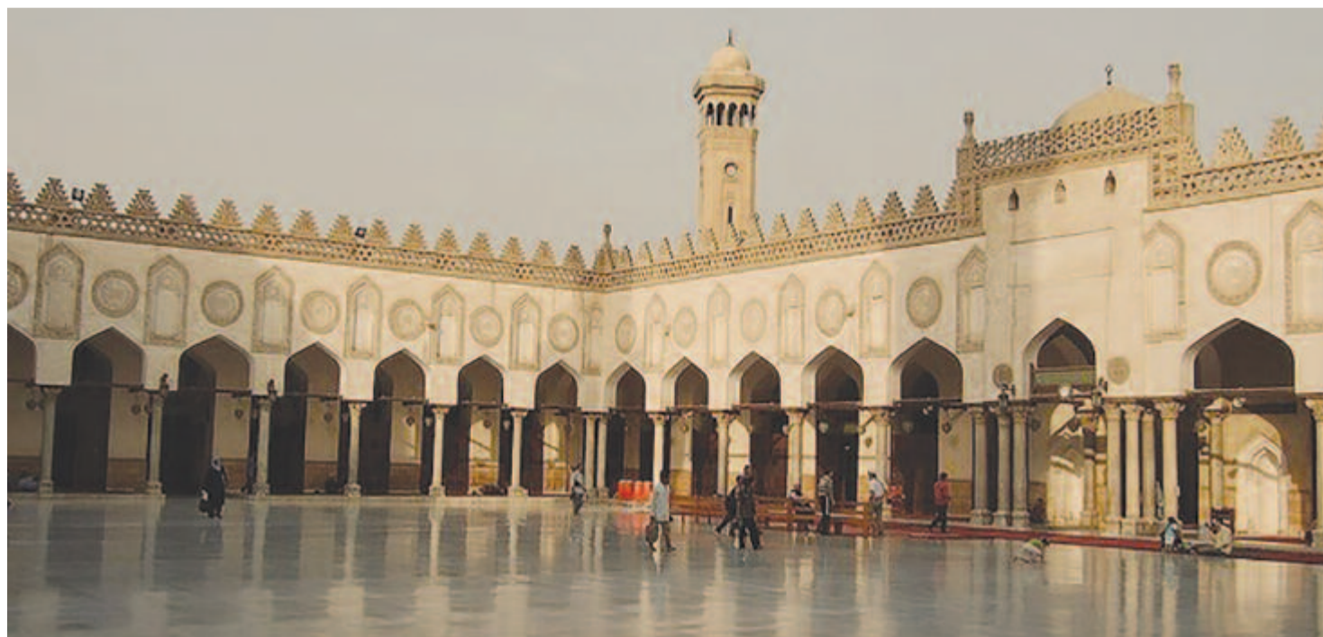
Az Al-Azhar-mecset Egyiptomban (A virágok egyeteme)