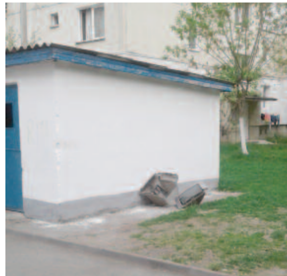
Nem mindenki viszi a hulladékot a begyűjtőközpontba

Míg az üveg 4.000, a műanyag 450, a pillepalack 1000, az alumínium csomagolóeszköz 200 év alatt bomlik le, az elektronikai berendezések a szakirodalom szerint sosem bomlanak le teljes mértékben. Az e-hulladékokból olyan veszélyes anyagok bomolhatnak le, mint az ólom, mely vesekárosító, fiatal korban a szellemi fejlődést hátráltatja. A báriumvegyületek is mérgezők,