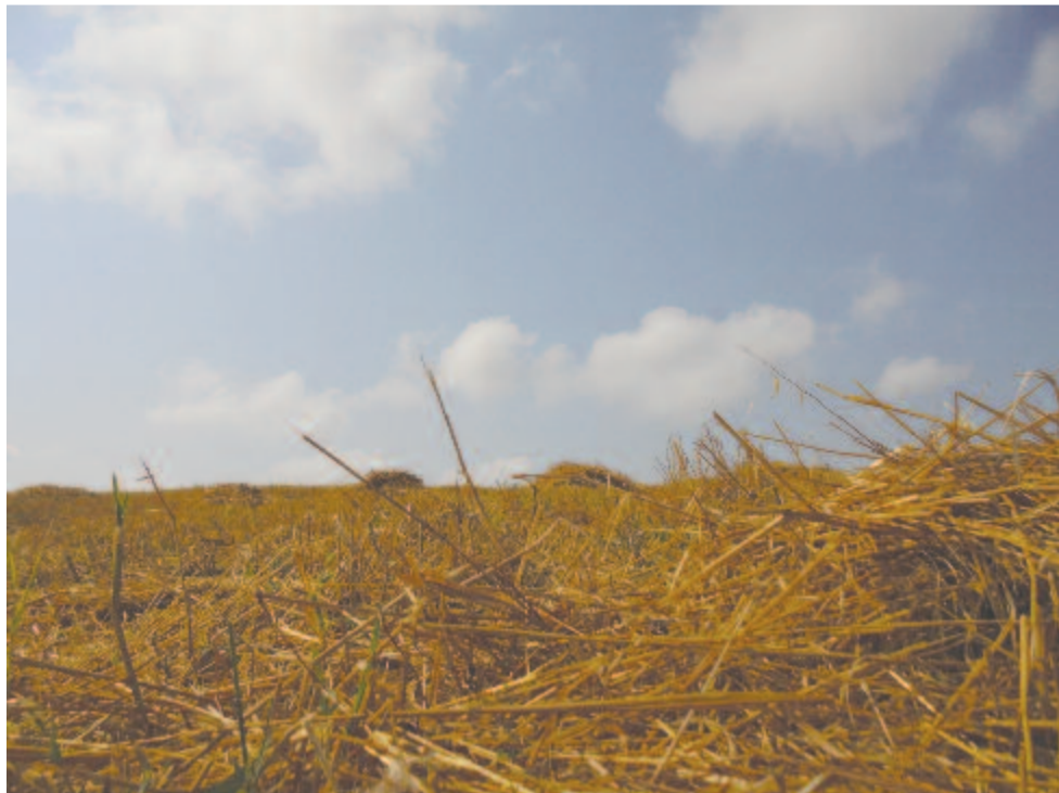
Így a nyár megadván világának javát, őszi, s halálához készítgeti magát – zabföld aratás után Faragó határában

De térjünk vissza a magashegyek világából a Kárpát-medence lágyabb tájaira. Ez idő tájt, 1772-ben vetette papírra Bessenyei György a Hunyadi László tragédiája toldalékának verseit , köztük Az esztendőnek négy részéről darabjait, ami az emberi életet végigtekintő, több mint tízezer soros tankölteménye, A természet világa vagy A józan okosság előmunkálatának is tekinthető.